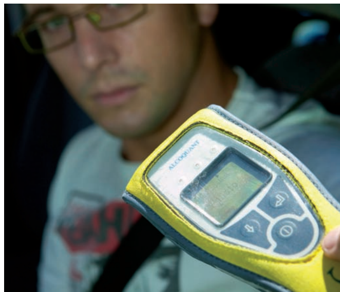
Por negarse a las pruebas de alcohol, podrán inmovilizar su vehículo.

Programar el navegador en marcha o circular con la matrícula ilegible son infracciones graves (200 €)