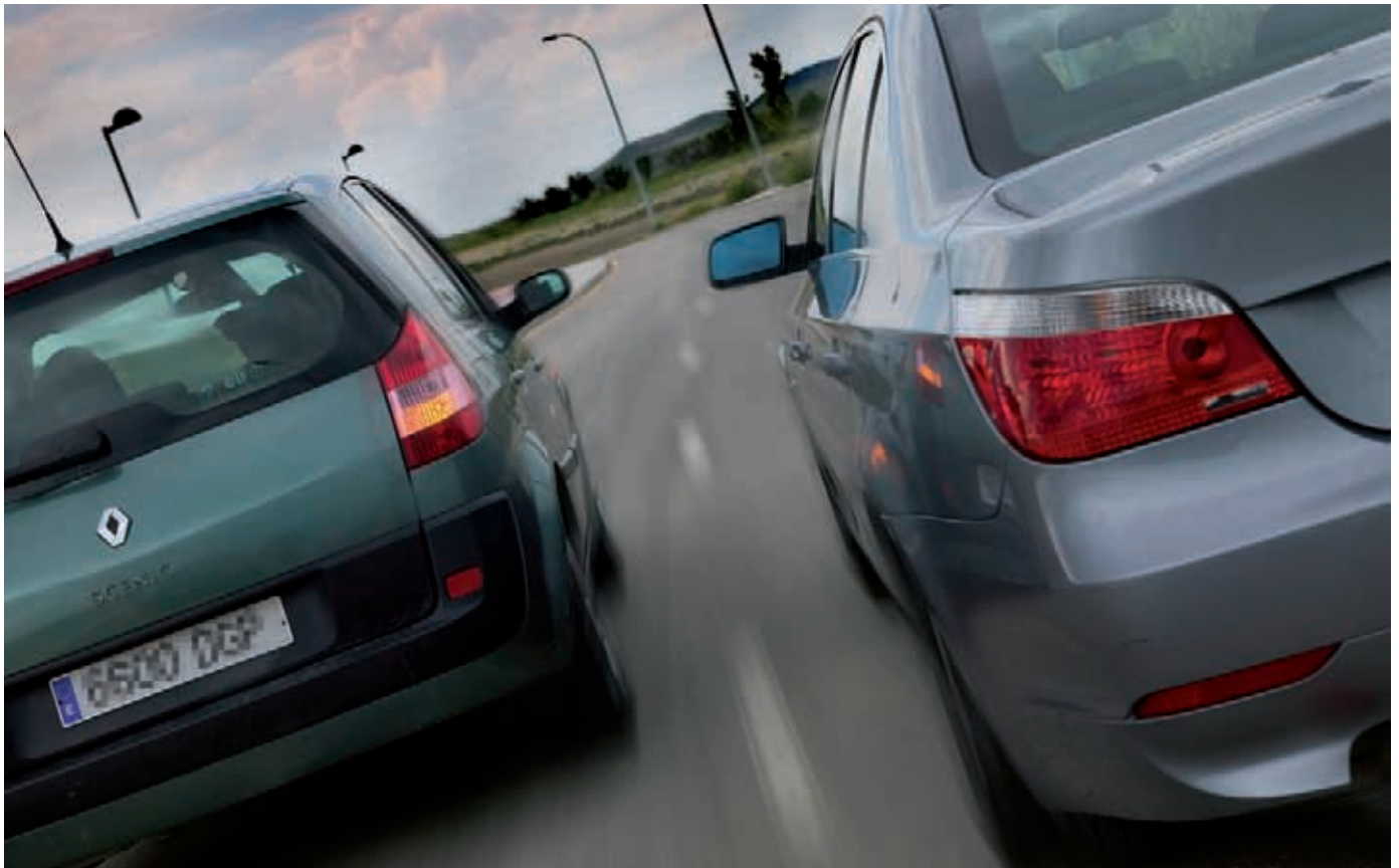
La reforma de la Ley busca mayor seguridad en calles y carreteras.

Pagar las multas antes de 20 días costará la mitad y se reducen de 27 a 20 las infracciones que restan puntos, pero será más difícil eludir las responsabilidades. Estas son algunas novedades de la reforma de la Ley de Seguridad Vial, que contempla sistemas electrónicos para agilizar la notificación de las multas y supone un paso adelante para mejorar la seguridad.