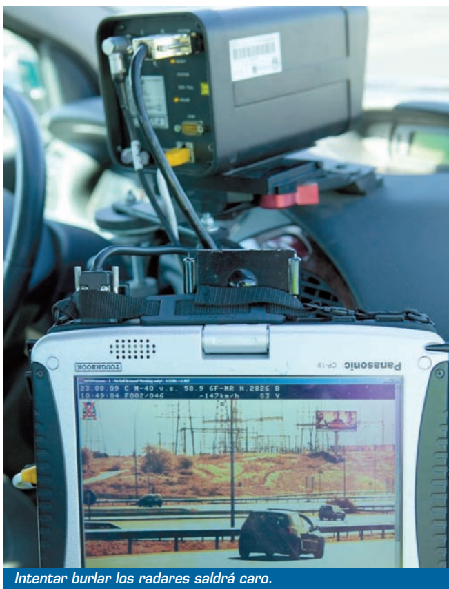
Intentar burlar los radares saldrá caro.