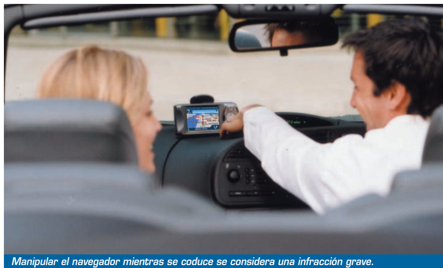
Manipular el navegador mientras se conduce se considera una infracción grave.

de 11 millones corresponden a ayuntamientos), y facilitar el acceso electrónico de los ciudadanos en lo que a materia de tráfico y sanciones se refiere.