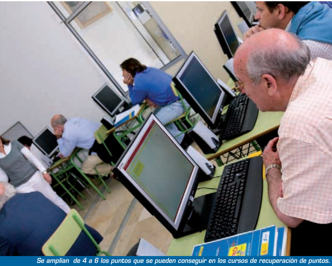
Se amplían de 4 a 6 los puntos que se pueden conseguir en los cursos de recuperación de puntos.