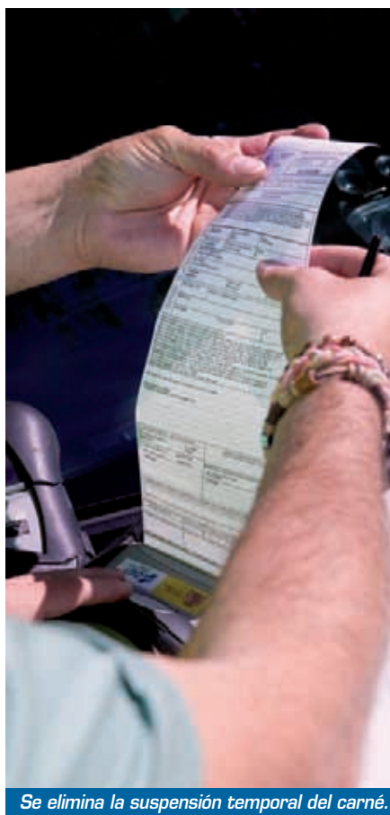
Se elimina la suspensión temporal del carné.

infracciones muy graves la conducción con aparatos que inhiban o interfieran los radares (se pasa de 150 a 6.000 euros de multa), así como la conducta de aquellas empresas que realicen actividades industriales contrarias a la seguridad vial, como la instalación de dichos aparatos, cuya sanción será de hasta 20.000 euros. Y, también a partir de ahora, circular en bicicleta por la noche sin elementos reflectantes y sin usar el alumbrado reglamentario se consideran infracciones leves.